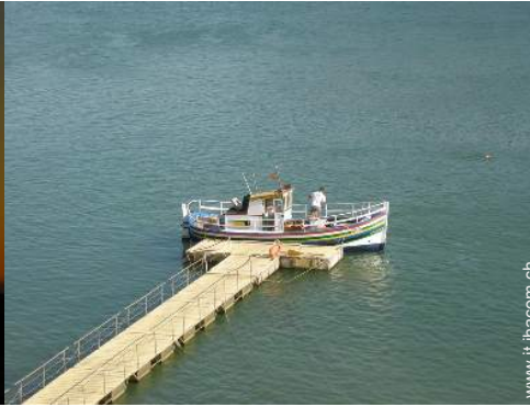
attività di volo nelle vicinanze