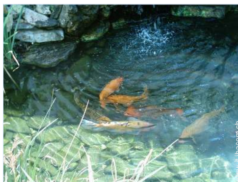
piscina fuori terra