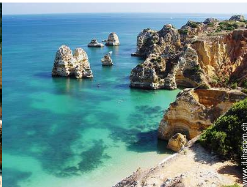
spiaggia dei nudisti