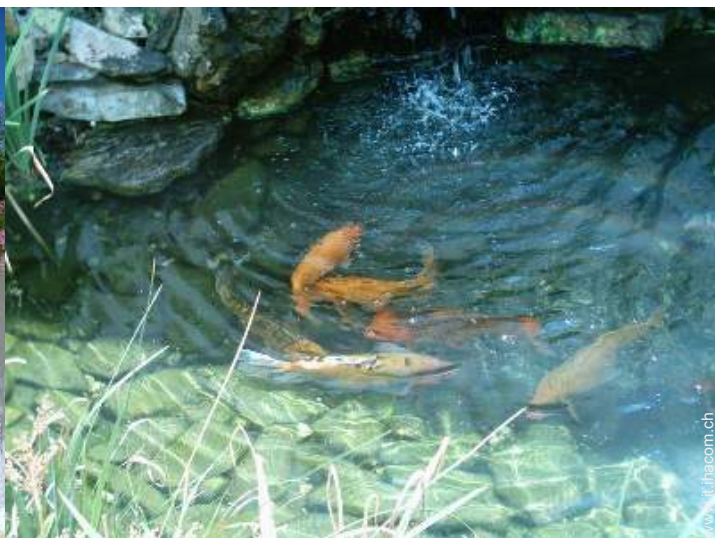
piscina fuori terra