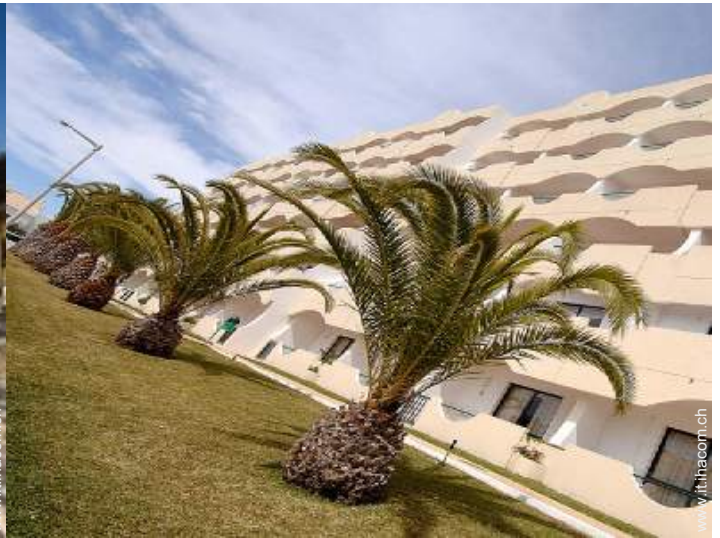
Appartamento di Charme