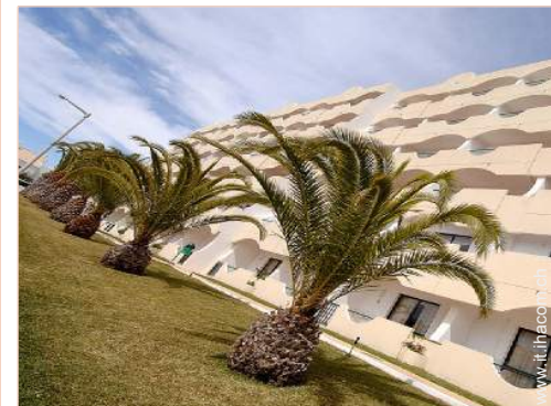
Appartamento di Charme