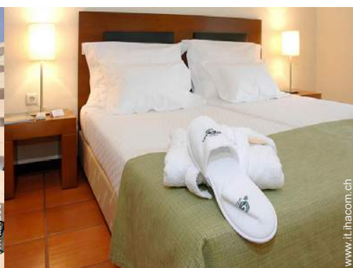
Appartamento di Charme