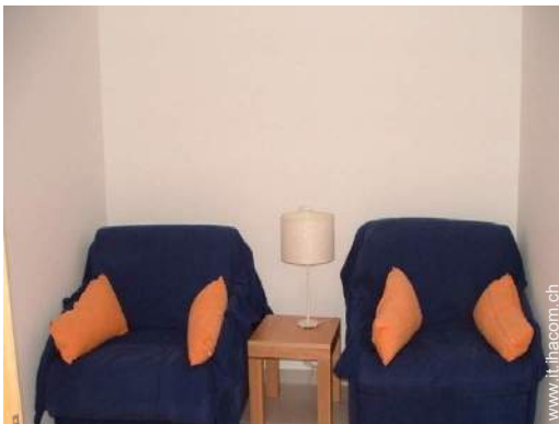
letto(i) a scomparsa 2 pers