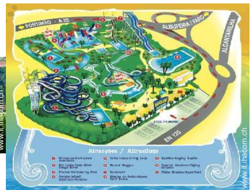
parco dei divertimenti