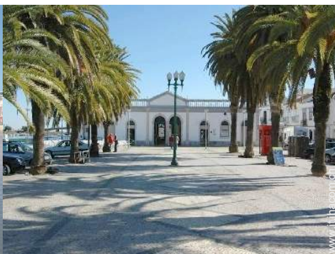
vista sul centro città