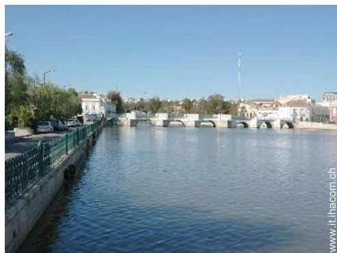
vista sul centro città