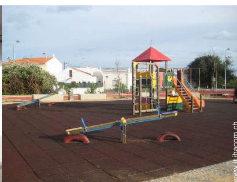
parco dei divertimenti