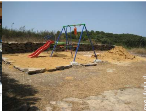
struttura rampicante per bambini