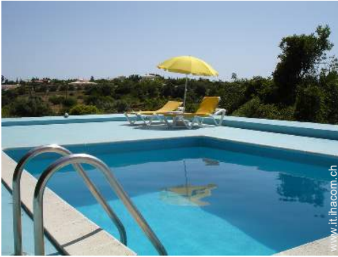
sistema di illuminazione