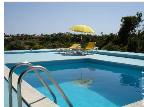
sistema di illuminazione