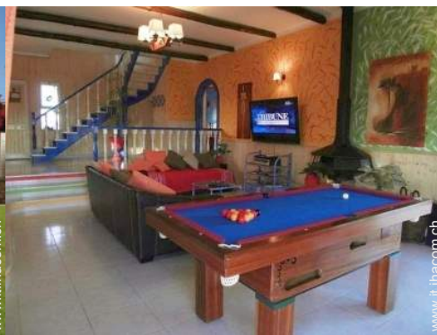
tavolo da biliardo