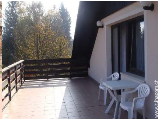
terrazzo sul tetto