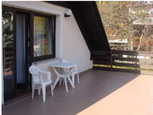
terrazzo sul tetto