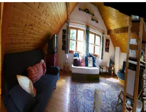
attrezzo(i) per il fitness