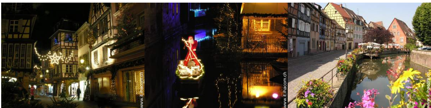
vista sulla piazza