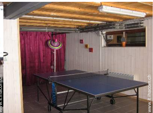
sala dei giochi