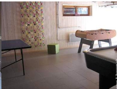
sala dei giochi