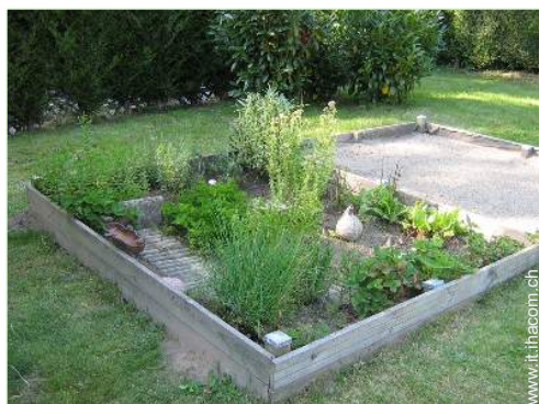
vasca per la sabbia