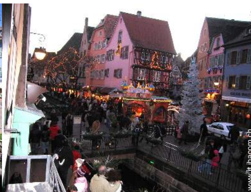
vista sulla piazza