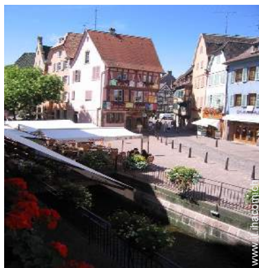
vista sulla strada pedonale