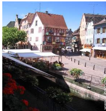
vista sulla strada pedonale