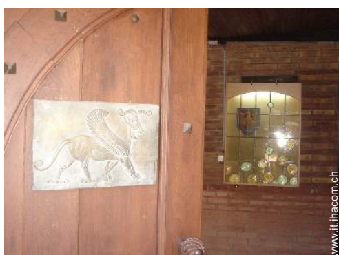
vista dal patio