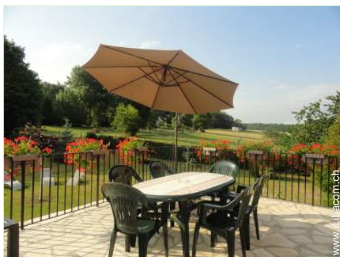
Attrezzature esterne a disposizione degli ospiti