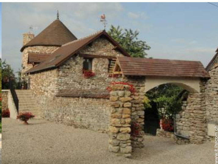
Attrezzature esterne a disposizione degli ospiti