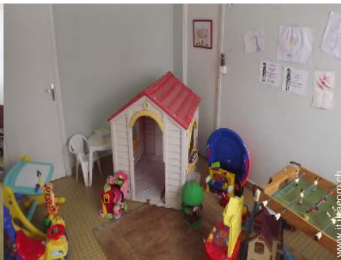
sala dei giochi