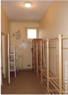
armadio per gli sci