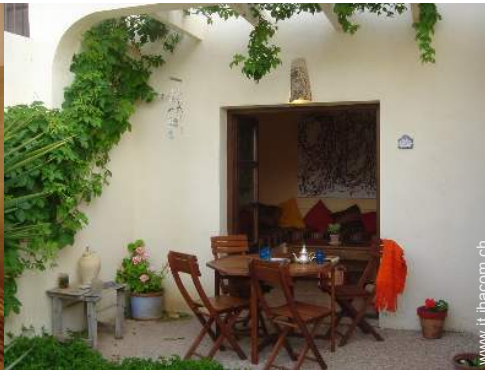
tettoia di giardino