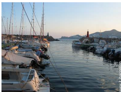
escursione in barca