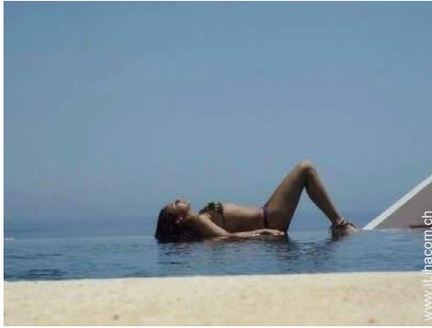
Piscina a sfioro