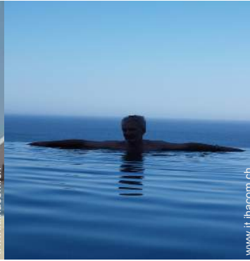
Piscina a sfioro