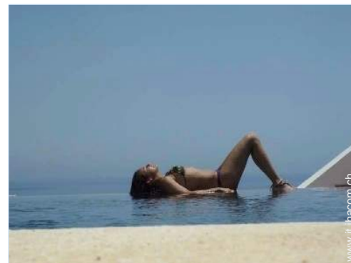
Piscina a sfioro

Barbecue, tavolo da giardino, sedia(e) da giardino, ombrellone, chaise(s) longue(s), sedia sdraio, amaca(che), doccia esterna