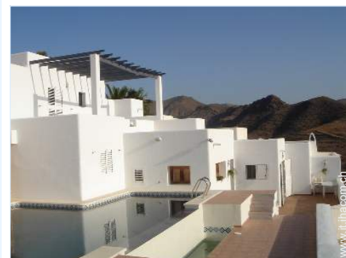
Piscina a sfioro