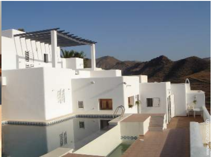
Piscina a sfioro