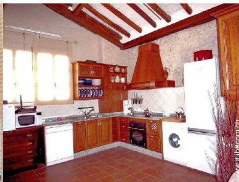
grande cucina in stile americano