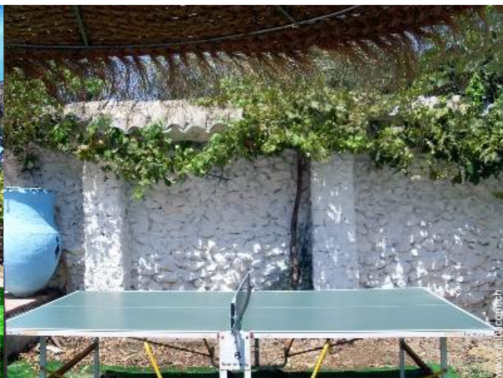
tavolo da ping-pong