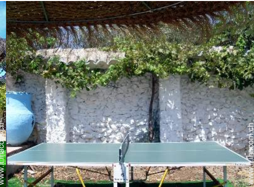
tavolo da ping-pong