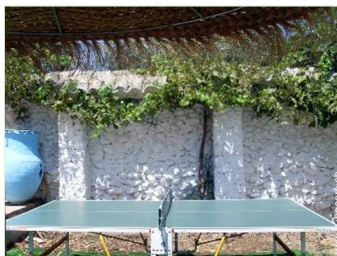
tavolo da ping-pong