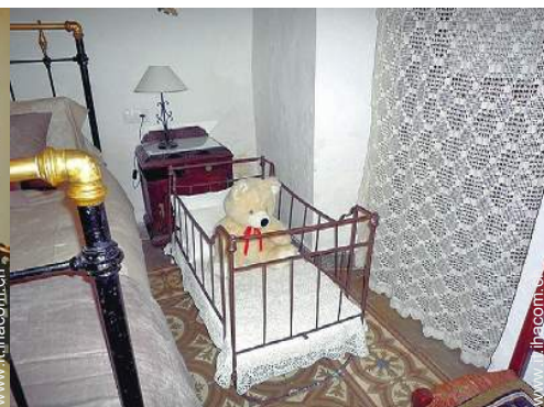
letto (i) bambino