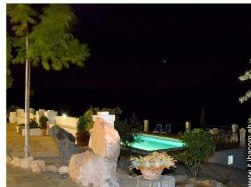
sistema di illuminazione