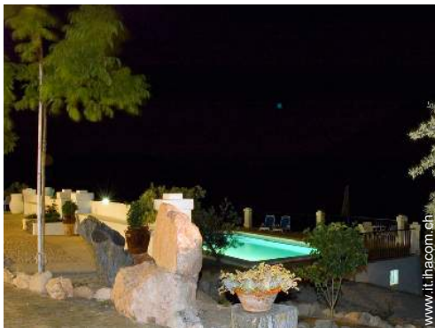
sistema di illuminazione