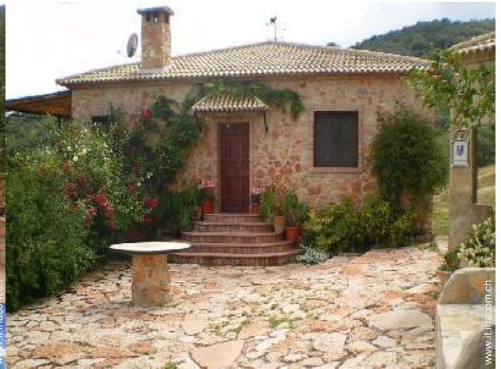
Casa in Pietra