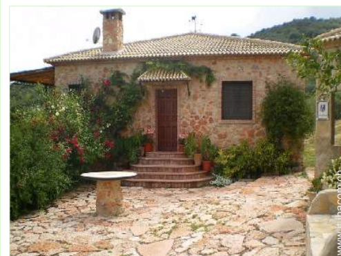
Casa in Pietra