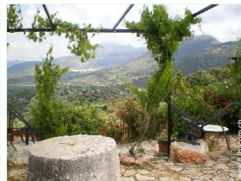
vista sui campi agricoli

Barbecue, tavolo da giardino, sedia(e) da giardino, ombrellone, salotto da giardino, 6 chaise(s) longue(s), dondolo, doccia esterna, WC esterno