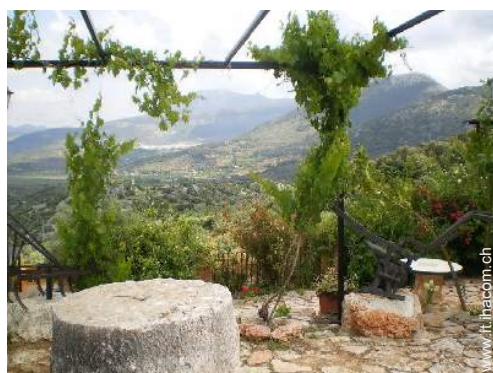
vista sui campi agricoli