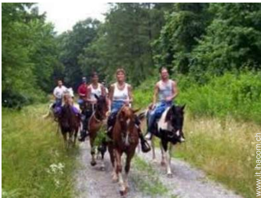
passeggiata a cavallo