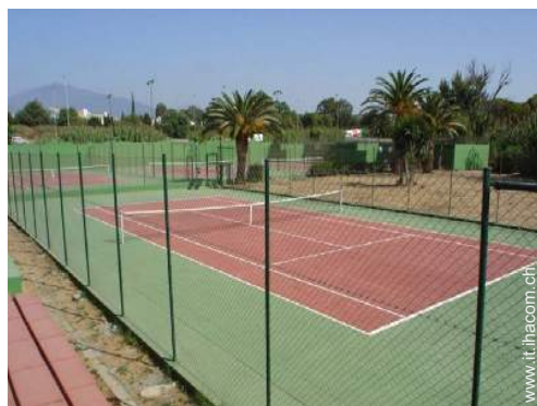
Tennis - superficie dura