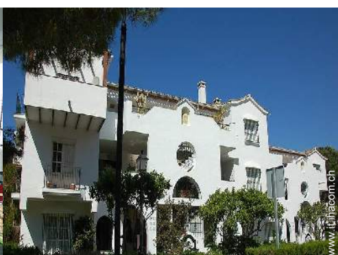
Residenza di Charme