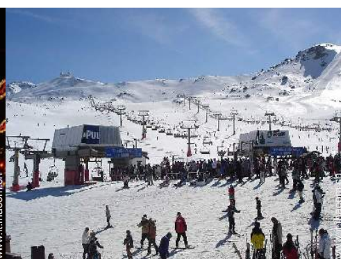
piste di sci