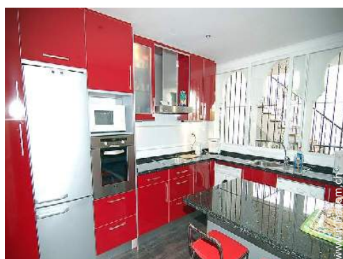
grande cucina indipendente