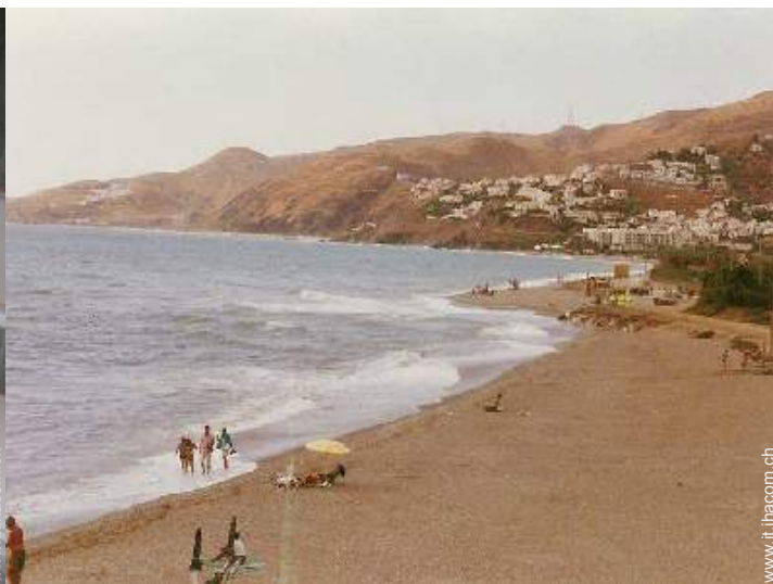
accesso diretto alla spiaggia