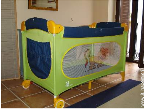
letto (i) bambino