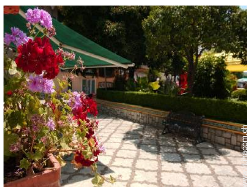
vista sul centro città