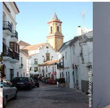
vista sul centro città