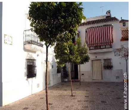
vista sul centro città