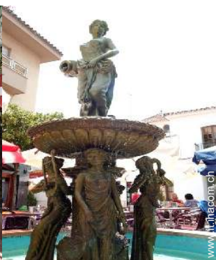
vista sul centro città