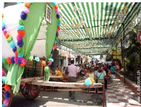
vista sulla città