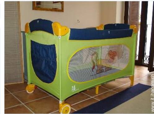
letto (i) bambino

Cucina esterna, salotto estivo, barbecue a gas, tavolo da giardino, 8 sedia(e) da giardino, pergolato, ombrellone, 4 sedia sdraio, dondolo, doccia esterna, WC esterno