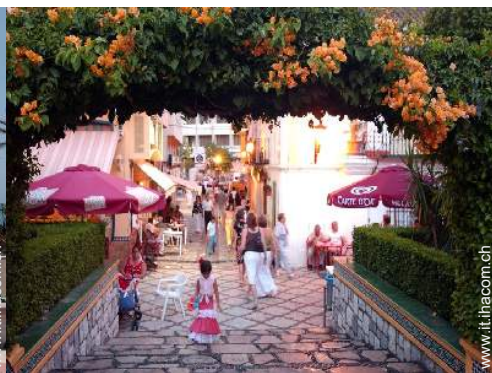
vista sul centro città