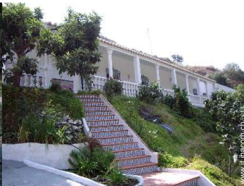
Casa di Campagna