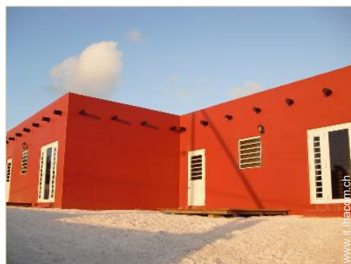
Appartamento di Prestigio

Privilegi : Accesso diretto alla spiaggia, campo pratica