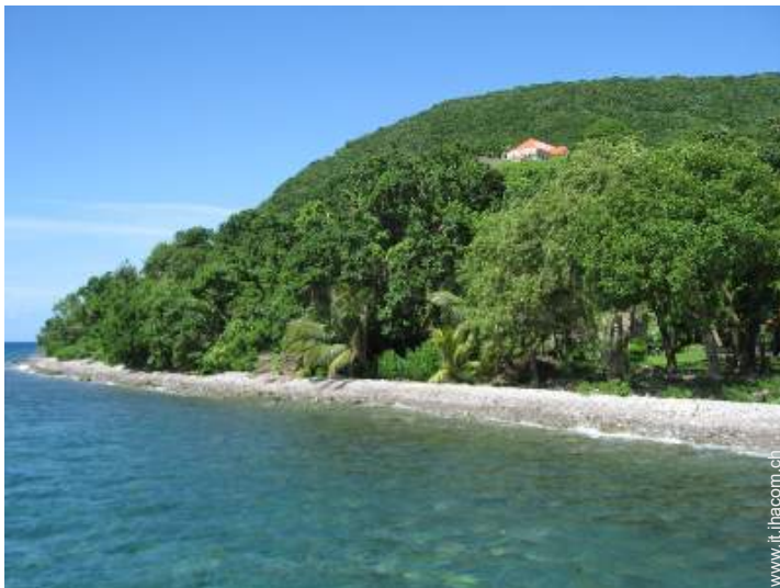
spiaggia con ciotoli