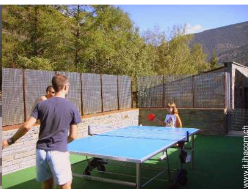
tavolo da ping-pong