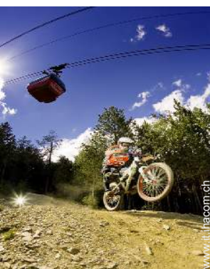
attività montane nelle vicinanze