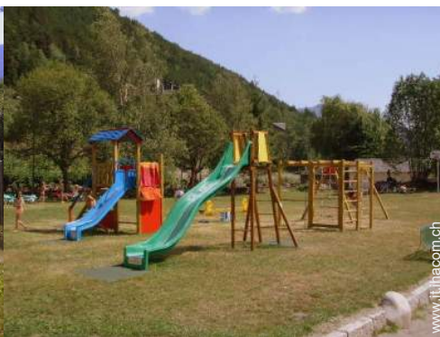
vasca per la sabbia