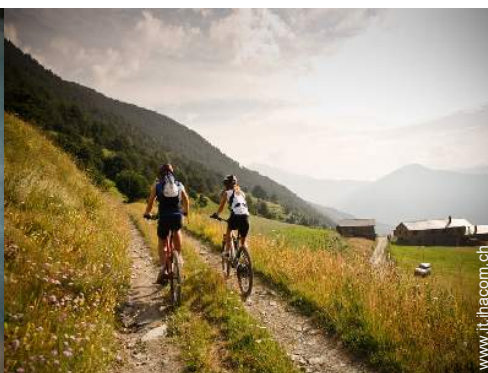
attività montane nelle vicinanze