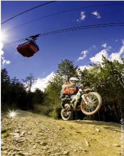
attività montane nelle vicinanze