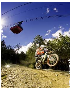
attività montane nelle vicinanze