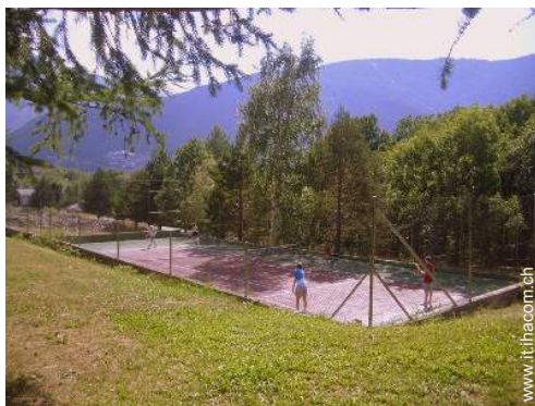
Attrezzature a disposizione