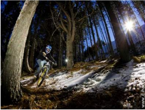
percorso per mountain bike