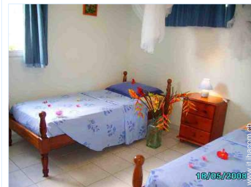
letti gemelli singoli