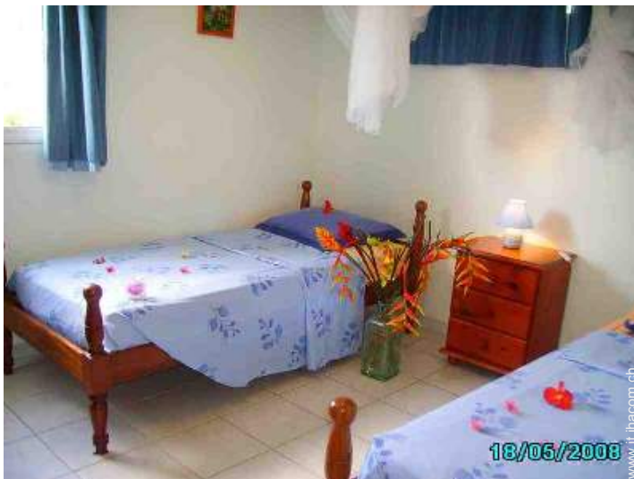
letti gemelli singoli