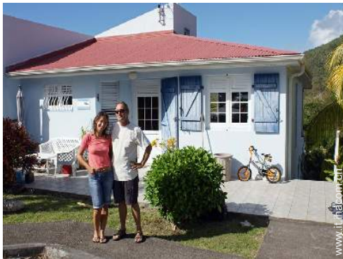
I vostri ospiti