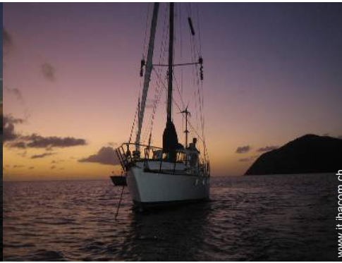
escursione in barca