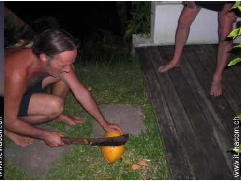
Presenza sul posto