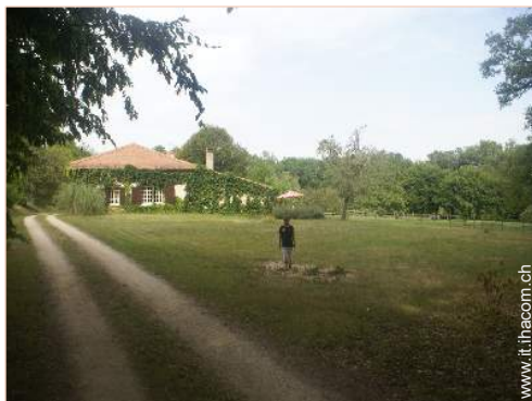
Appezamento di terreno