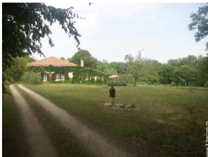
Appezamento di terreno