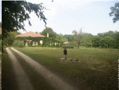
Apezzamento di terreno