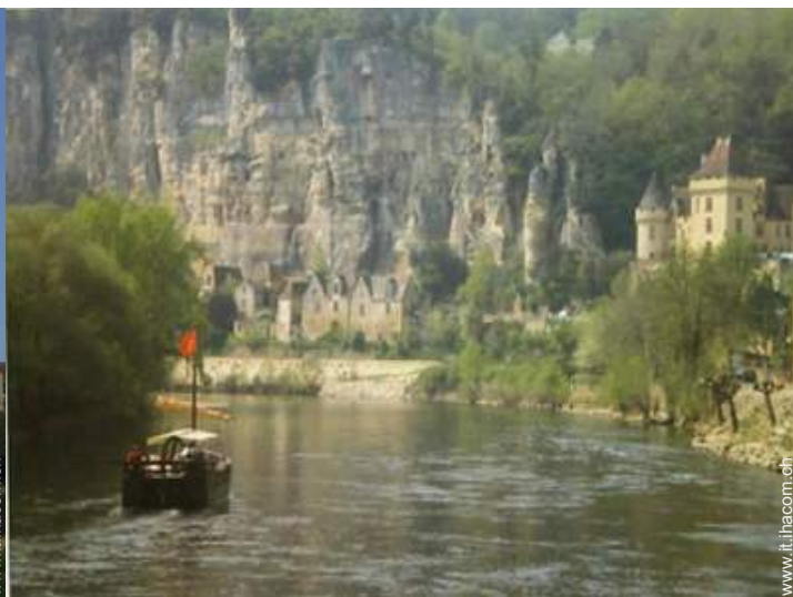
vista sul fiume