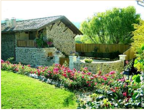
Casa di Charme