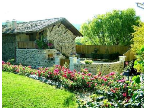
Casa di Charme