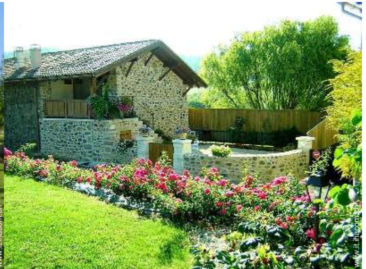
Casa di Charme