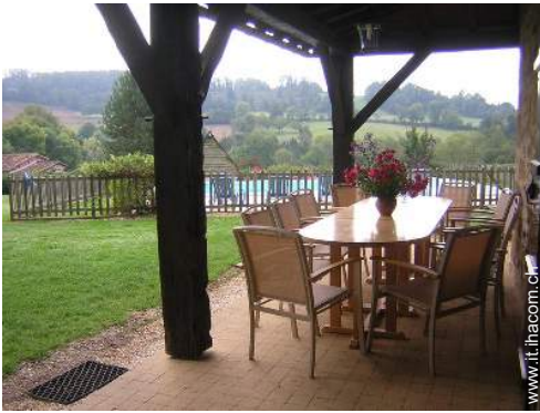
salotto da giardino