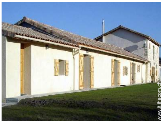
Antico Granaio di Charme