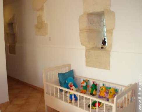
letto (i) bambino