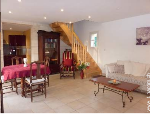
Comfort interno ed attrezzature