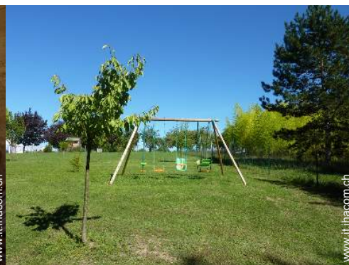
struttura rampicante per bambini