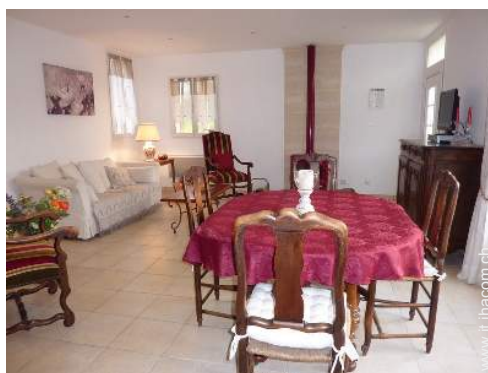
Comfort interno ed attrezzature