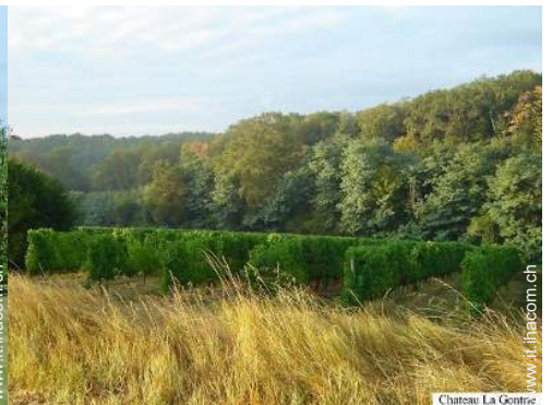
vista sui vigneti