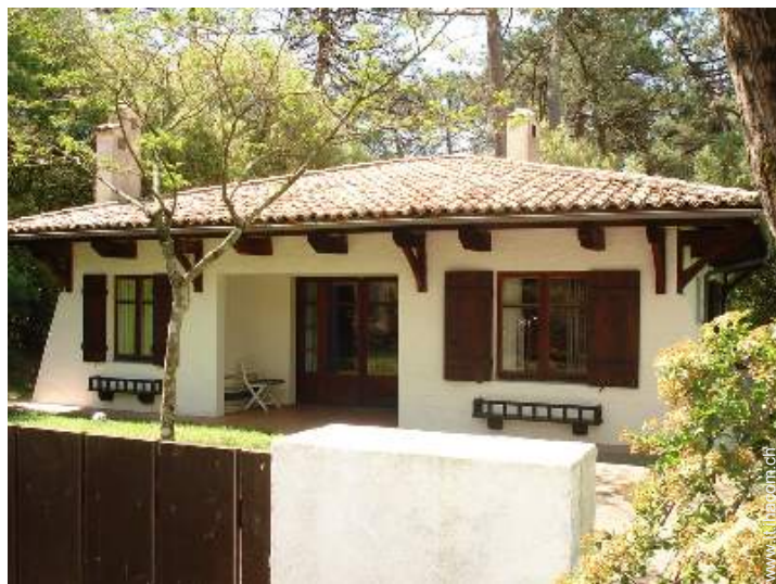
Villa di Charme