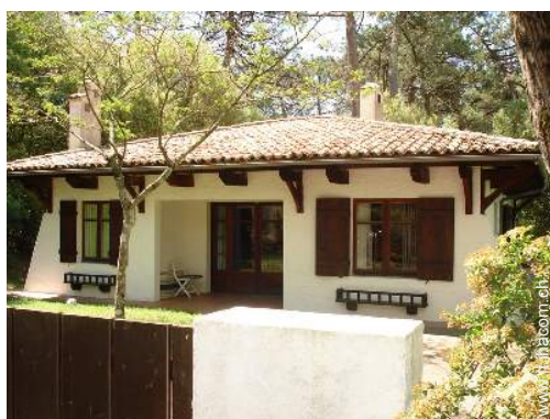
Villa di Charme