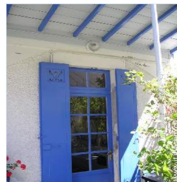
vista dalla loggia