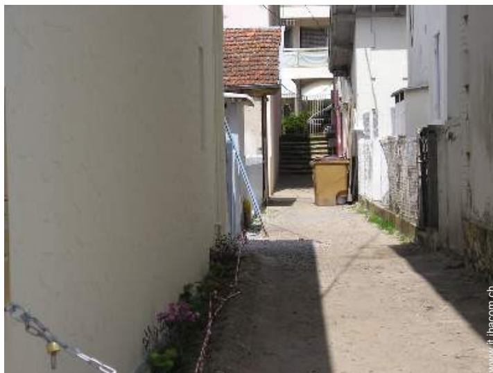
accesso diretto alla spiaggia