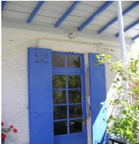
vista dalla loggia