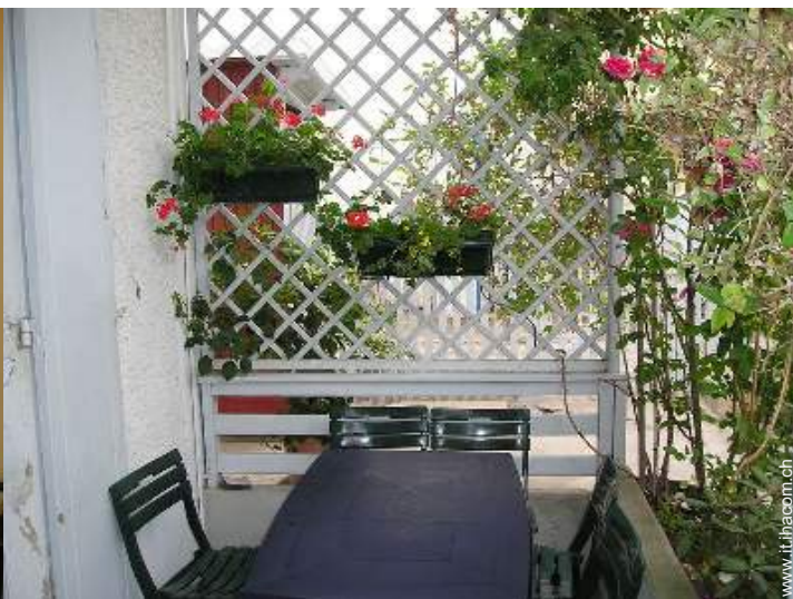
vista dalla loggia