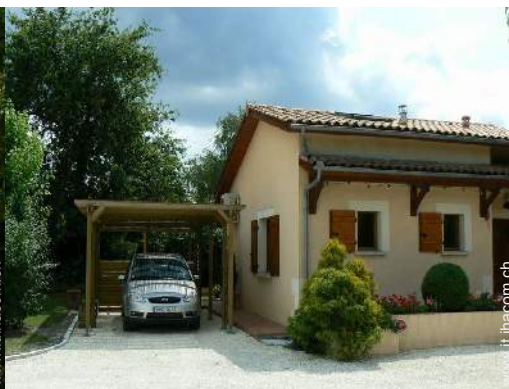
tettoia di giardino