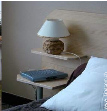
wifi (accesso ad internet senza filo)