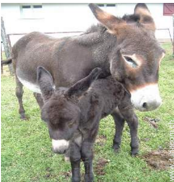
Gli animali domestici