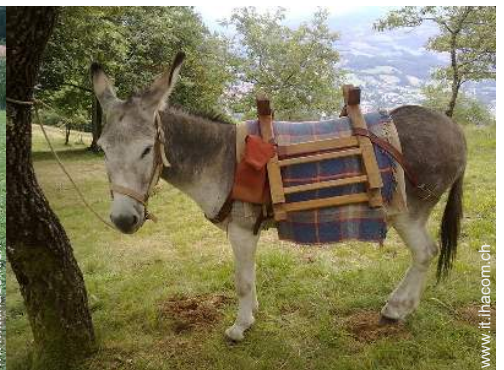
Gli animali domestici