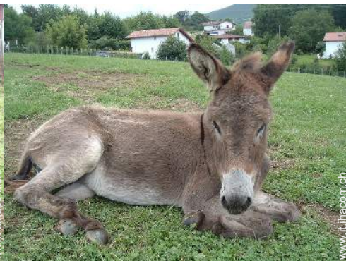
Gli animali domestici