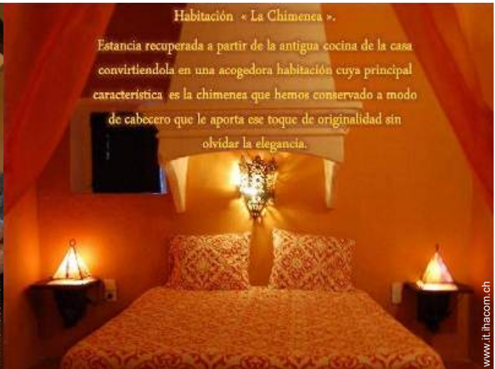
Habitación « La Chimenea ».

Estancia recuperada a partir de la antigua cocina de la casa convirtiendola en una acogedora habitación cuya principal característica es la chimenea que hemos conservado a modo de cabecero que le aporta ese toque de originalidad sin olvidar la elegancia.