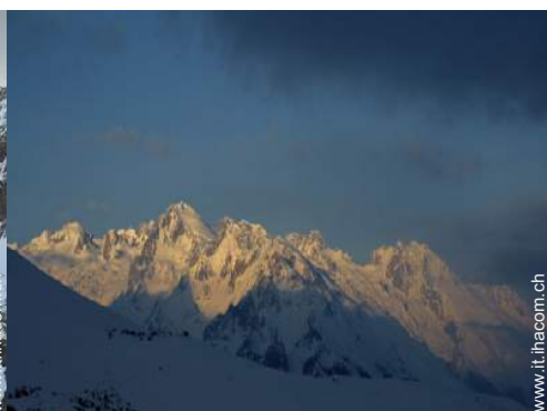
sport invernali nelle vicinanze