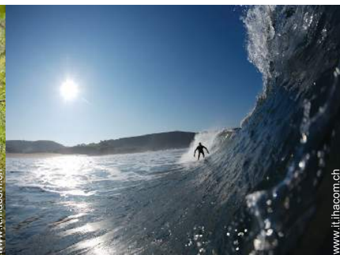
sport acquatici nelle vicinanze