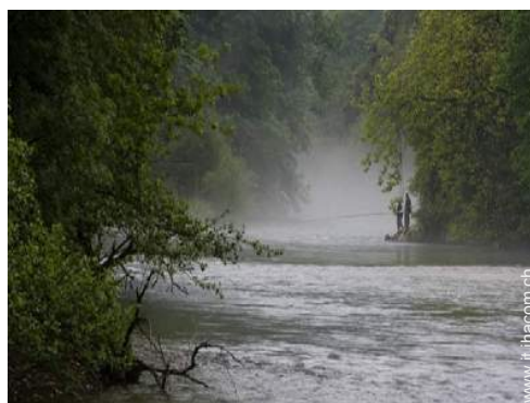
pesca con lenza