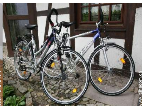
percorso per mountain bike