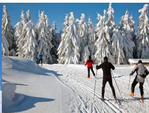
sci di fondo