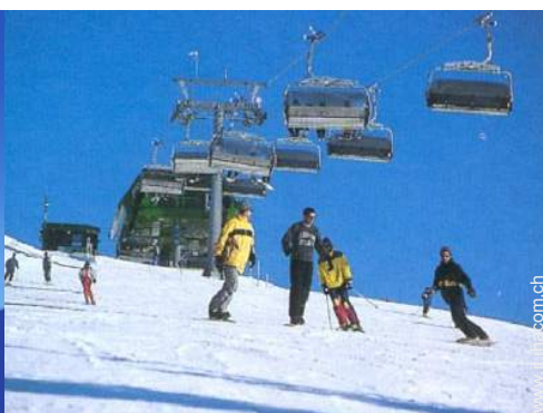
piste di sci