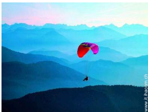
attività di volo nelle vicinanze