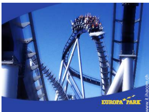
parco dei divertimenti