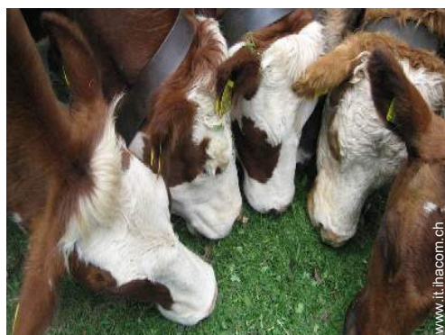
vista sul prato