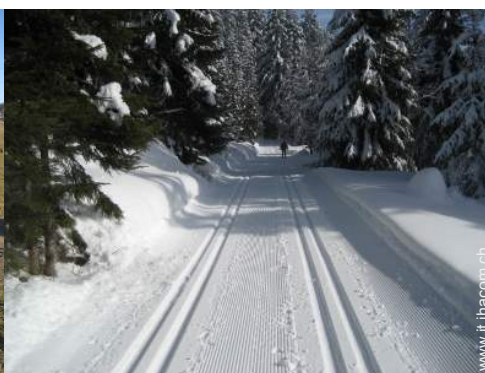
sport invernali nelle vicinanze