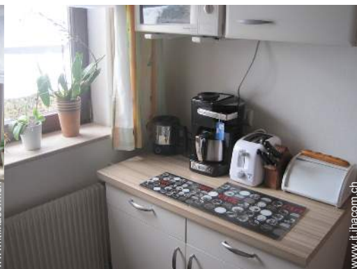
utensili e batteria da cucina